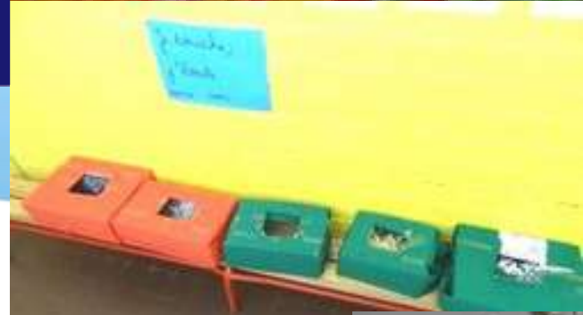
Boîtes à toucher