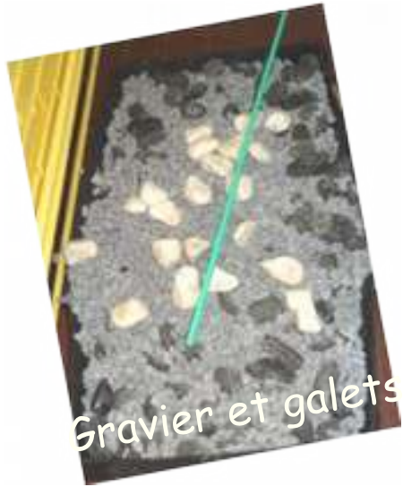
Gravier et galets