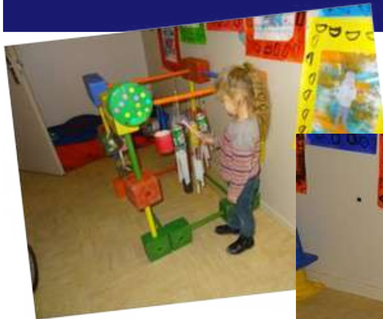
Chez les petits