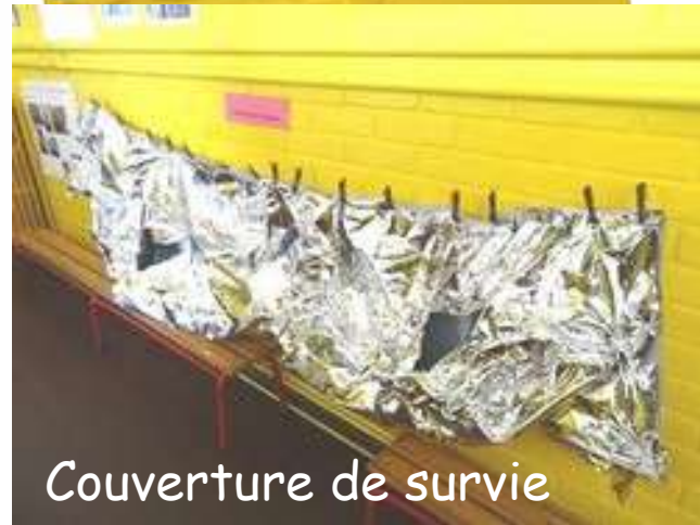
Couverture de survie