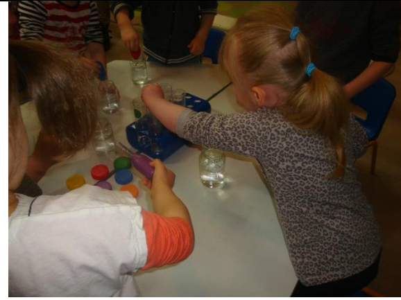
Transvaser de l'eau à l'aide d'une paille