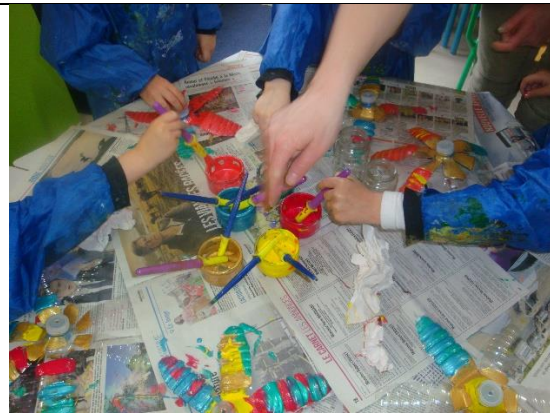
Décorer les moulins à vent