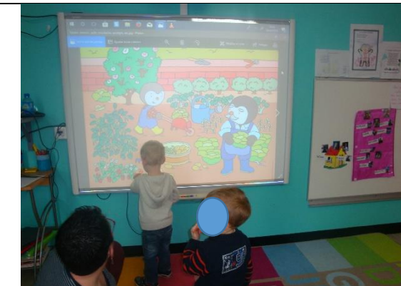
Cherche et trouve sur le TBI