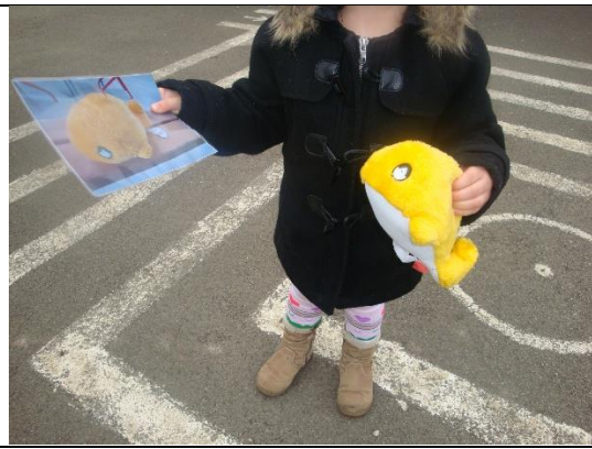
Chasse aux doudous dans la cour à partir de photos