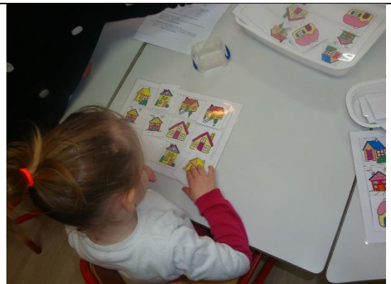
Trouver les maisons identiques