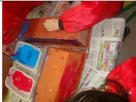
Décorer des jardinières, dans lesquelles les élèves planteront des bulbes. Les jardinières seront installées dans la cour de récréation.