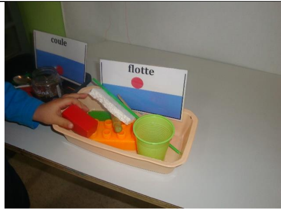
Classer des objets : coule ou flotte