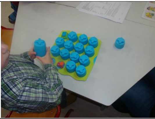
Jeu de mémoire