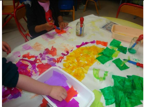
Coller du papier mouillé pour faire une production collective