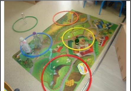
Classer des objets : ce jour, les élèves ont choisi de les classer selon leur ouverture : clipser, visser...