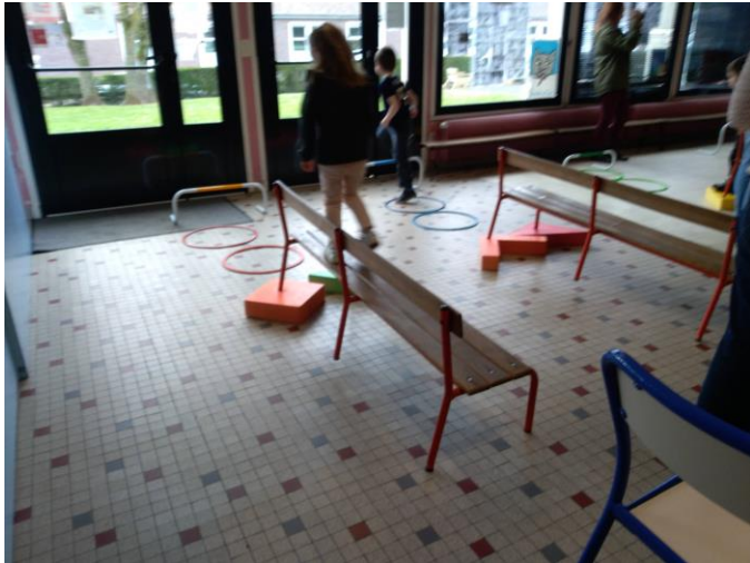
Le parcours de motricité

Les élèves ont travaillé autour de l'air avec le jeu coopératif : le parachute.