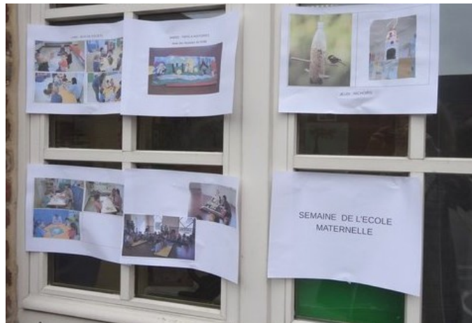
Les temps forts de la semaine affichés pour les parents